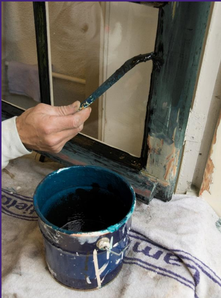
INSTANDHOUDEN & RESTAUREREN